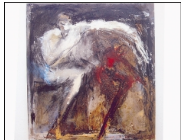
Todas las obras están realizadas con técnicas mixtas. S.E.