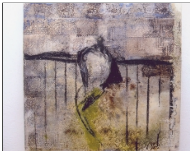
"Rompiendo los puentes". S.E.